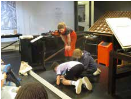
Bilder: Stefan Wolf