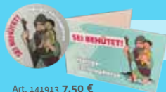
Art. 141913 7,50 €

Guter Gott, du begleitest uns auf den Wegen unseres Lebens. Hilf uns, rücksichtsvoll und verantwortungsbewusst unterwegs zu sein. Lass uns immer sicher und wohlbehalten an das Ziel unserer Fahrten gelangen. Halte schützend deine Hände über uns und segne uns auf die Fürsprache des heiligen Christophorus. Amen.