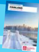
Art. 171217 6,90 €

Die Neuauflage des Länderheftes stellt Menschen und ihre Geschichten vor, die stellvertretend für die Vielfalt der katholischen Kirche in Finnland stehen. 80 Seiten, Format DIN A4